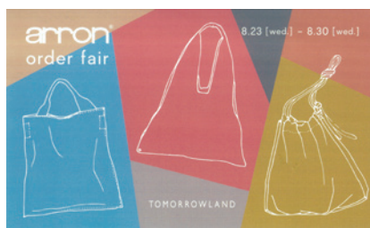
サガンGA プラチナホワイト 四六判250kg