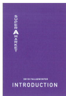
ハンマートーン GA紫 四六判170kg

この検収期間10日の支払いは15年前から実行しています。この間の用紙店さんとの長いコミュニケーションから社内に特殊紙の専門家もそろい、①特殊紙の品揃え②枚数確保の力は印刷業界の中でも群を抜いています。