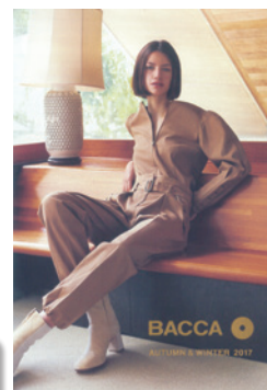
スノーブル FS L判246.5kg