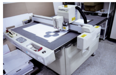
1. 最大対応サイズ800mm×1100mm 2. 最大資材加工厚5mm

実際の量産では抜き型が必要ですが、サンプル試作の段階ではコスト面でも時間の面でも型を作りませんので、1枚でも試作を可能にするカッティングマシンが活躍します。