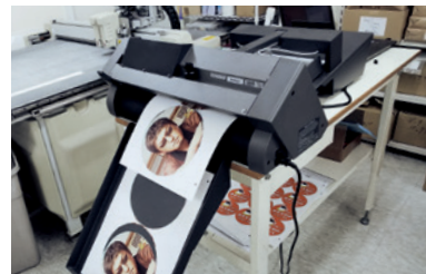
1. A3/レ、A3、A4に対応、最大対応サイズ350mm×500mm 2. 最大積載メディア厚35mm以下または最大枚数200枚の連続加工が可能

さらにハーフカットに加えて、ミシン目カットも可能なため、ラベル、POP等の用途でもご活用いただけます。